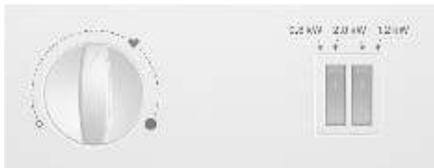
Рисунок 2. Панель управления водонагревателя

(стандартный), оба переключателя зажать одновременно – 2000 Вт (ускоренный). Чтобы выключить водонагреватель, необходимо перевести регулятор в положение «0».